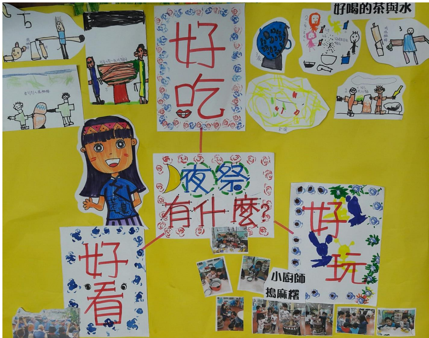
--荖濃夜祭地方文化課程活動主題網--